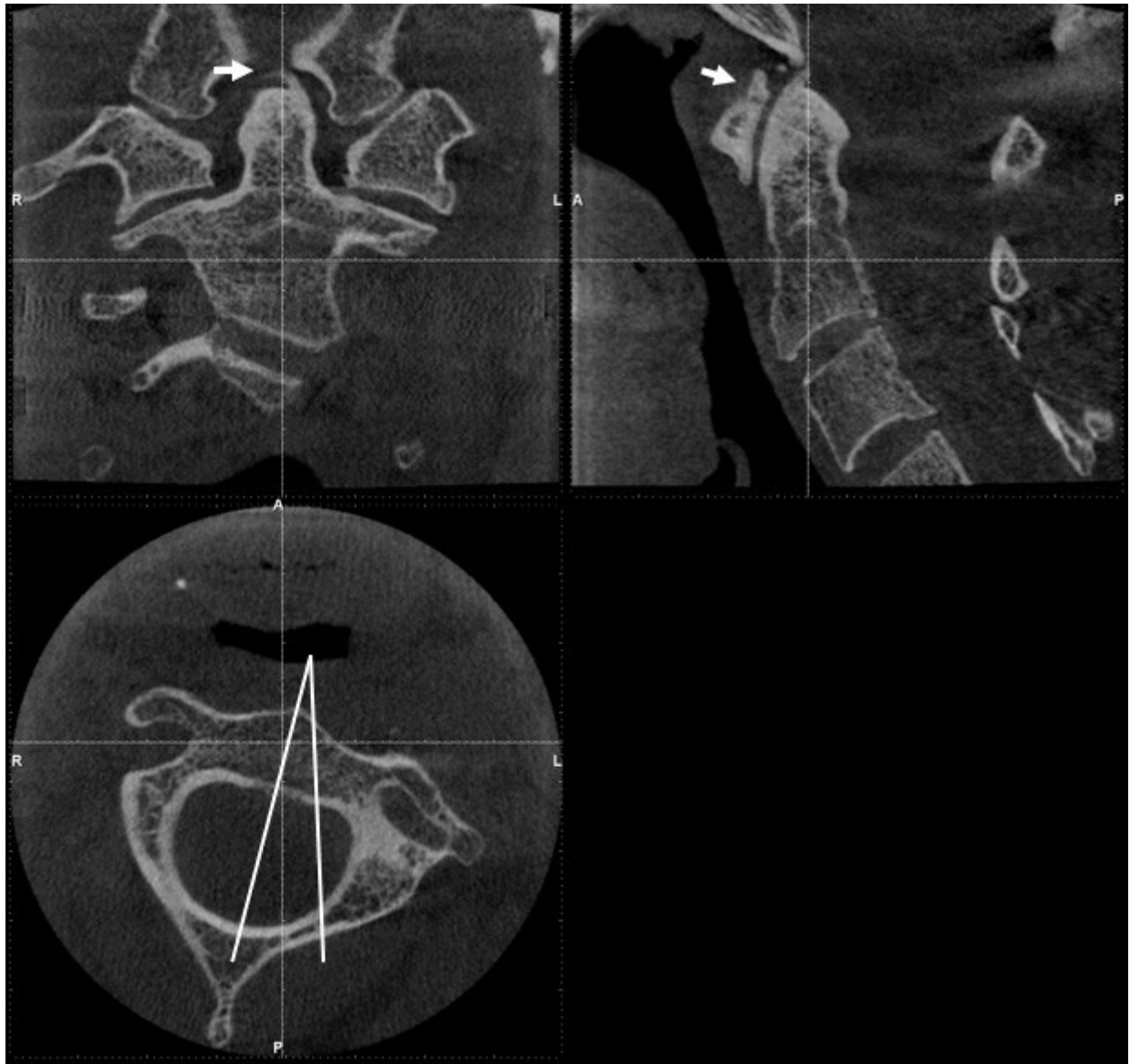
tulostus 2. Kuvissa näkyy ligamenttiavulsiomurtumien jälkitiloja (nuolet) ja C2 nikaman huomattava rotaatio eli kiertymä.